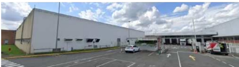
Vue de l'entrée routière du site de La Suze (72)